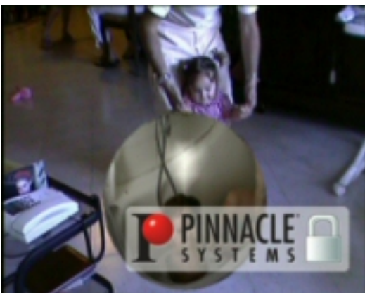
Figura 1 - Una transizione bloccata.

Come per gli effetti, non tutte le transizioni che vedete all'interno dell'album di studio sono utilizzabili. Alcune vanno sbloccate (le distinguate perché accanto al loro nome è presente un lucchetto), comprando la chiave di sblocco sul sito Pinnacle ( www.pinnaclesys.com ). In particolare, sono bloccate quasi tutte le transizioni Hollywood FX. Studio vi permette di inserire una transizione bloccata nel filmato, ma quando la riproduce, la introduce con un suono simile a una sirena e mostra il suo logo con un lucchetto in sovrapposizione ( Figura 1 ).