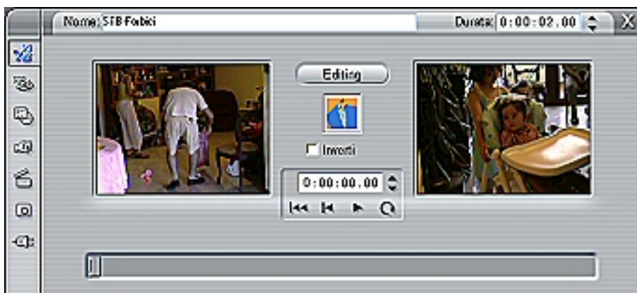
Figura 4 – Una transizione Hollywood FX.

Le transizioni Hollywood FX, anche quelle liberamente utilizzabili della categoria Hollywood FX per Studio, prevedono la possibilità di modifiche personalizzate (Figura 4).