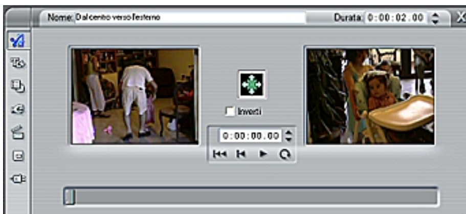
Figura 3 - Lo strumento Proprietà clip relativo alle transizioni

Potete modificare le impostazioni di ogni singola transizione: facendo doppio clic su di essa si apre lo strumento Proprietà clip relativo alle transizioni ( Figura 3 ).