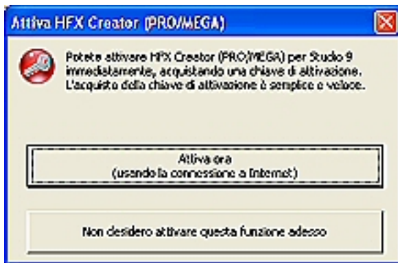
Figura 5 - Studio propone l'acquisto di HFX Creator

Con questo programma potrete anche creare delle transizioni ex novo .